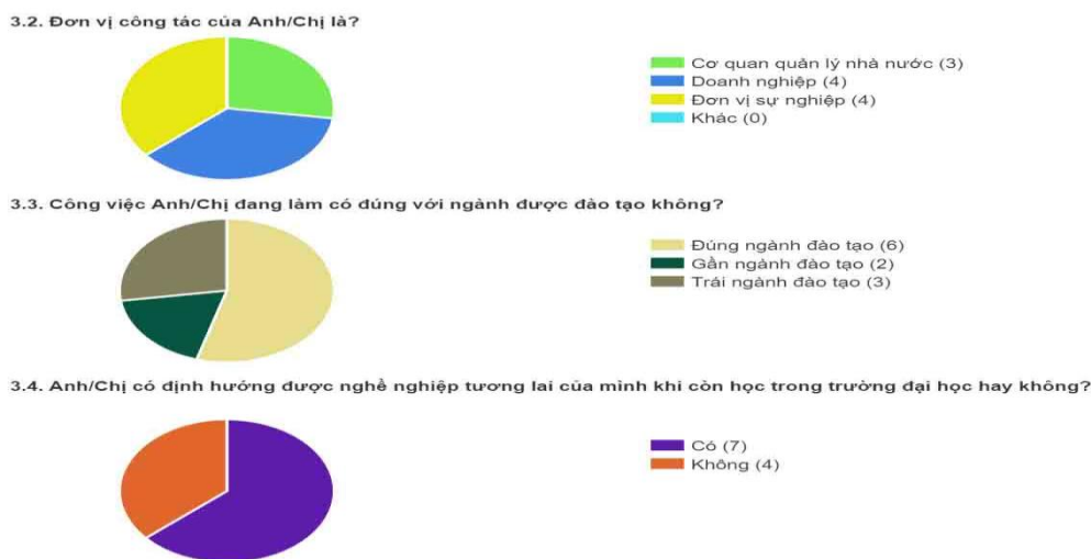
Hình 5: Biểu đồ thống kê tỉ lệ % theo câu hỏi